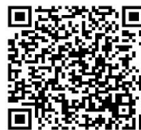
グループステージ

総合案内にてプレスパス、大会プログラムをお受け取りください。 メンバー、結果はGoalNoteCloudでご確認ください。 グループステージ: http://gn-c.net/15493 ノックアウトステージ: http://gn-c.net/15498 なお、プレス控室はございませんので予めご了承ください。